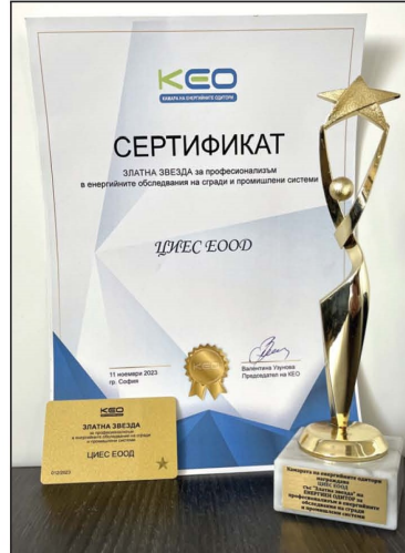
Престижна награда от Камарата на енергийните одитори

Във връзка със зеления преход и мерките за повишаване на енергийната ефективност, в началото на годината бяха отворени за кандидатстване европейски програми, свързани с обследването за енергийна ефективност на сгради в експлоатация. Тъй като ЦИЕС е едно от първите лицензирани дружества в България за енергийно обследване на сгради и промишлени системи, към нас се обърнаха много клиенти най-ве-