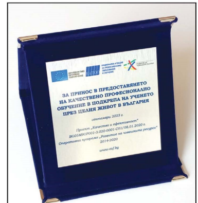
Наградата от Националната агенция за професионално образование и обучение

оборудването е приоритет за нас. За съжаление много дълго време нямаше такива програми, по една или друга причина. Едва миналата година беше обявена програма за технологична модернизация в МСП, ние се възползвахме и кандидатствахме. Впоследствие спечелихме проекта и очакваме съвсем скоро да получим апаратурата, която сме поръчали. Част от нея е предназначена за най-новата ни лаборатория за изпитване на респираторни маски. Подготвяме се за акредитацията ѝ, това е следващата ни стъпка.